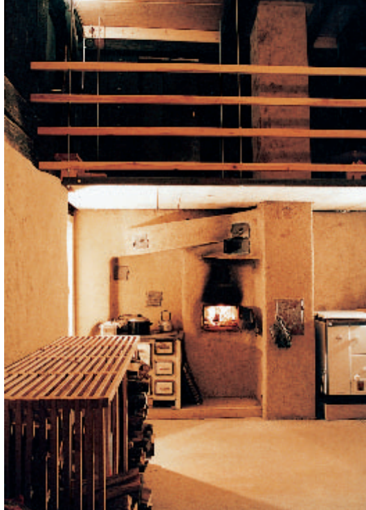
2 Nach der Herausnahme der Zwischendecke in der ehemaligen Rauchküche ist die ursprüngliche Dimension des Raumes wieder erlebbar. Links befindet sich die bisherige alte Befeuergstelle von „Kunst“ und Kachelofen, auf der rechten Bildseite der neue Herd für die Holzzentralheizung.