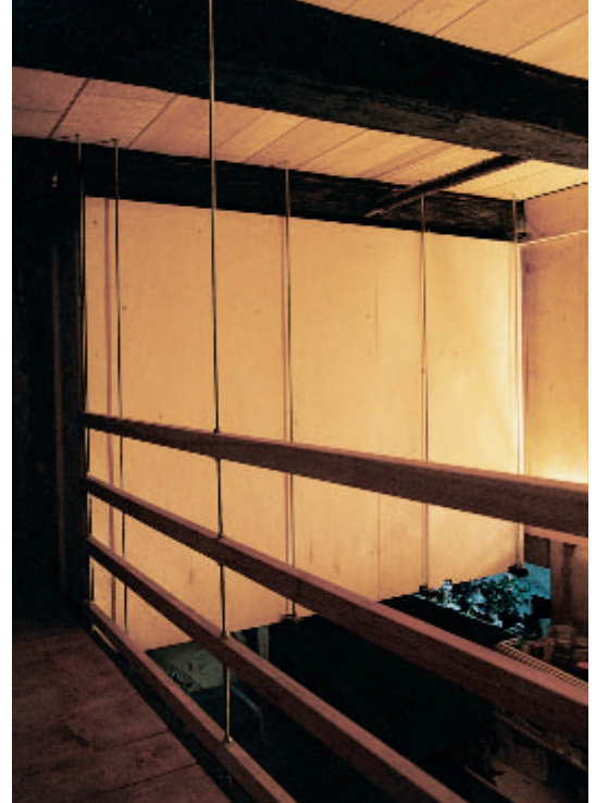
3 Die Sanitärzelle und der Erschließungssteg sind mit Gewindestangen an Überzügen über der Wohnteildecke aufgehängt. Durch die Nutzung des Luftraumes der Rauchküche musste keine der Kammern und Stuben zum Bad umfunktioniert werden.